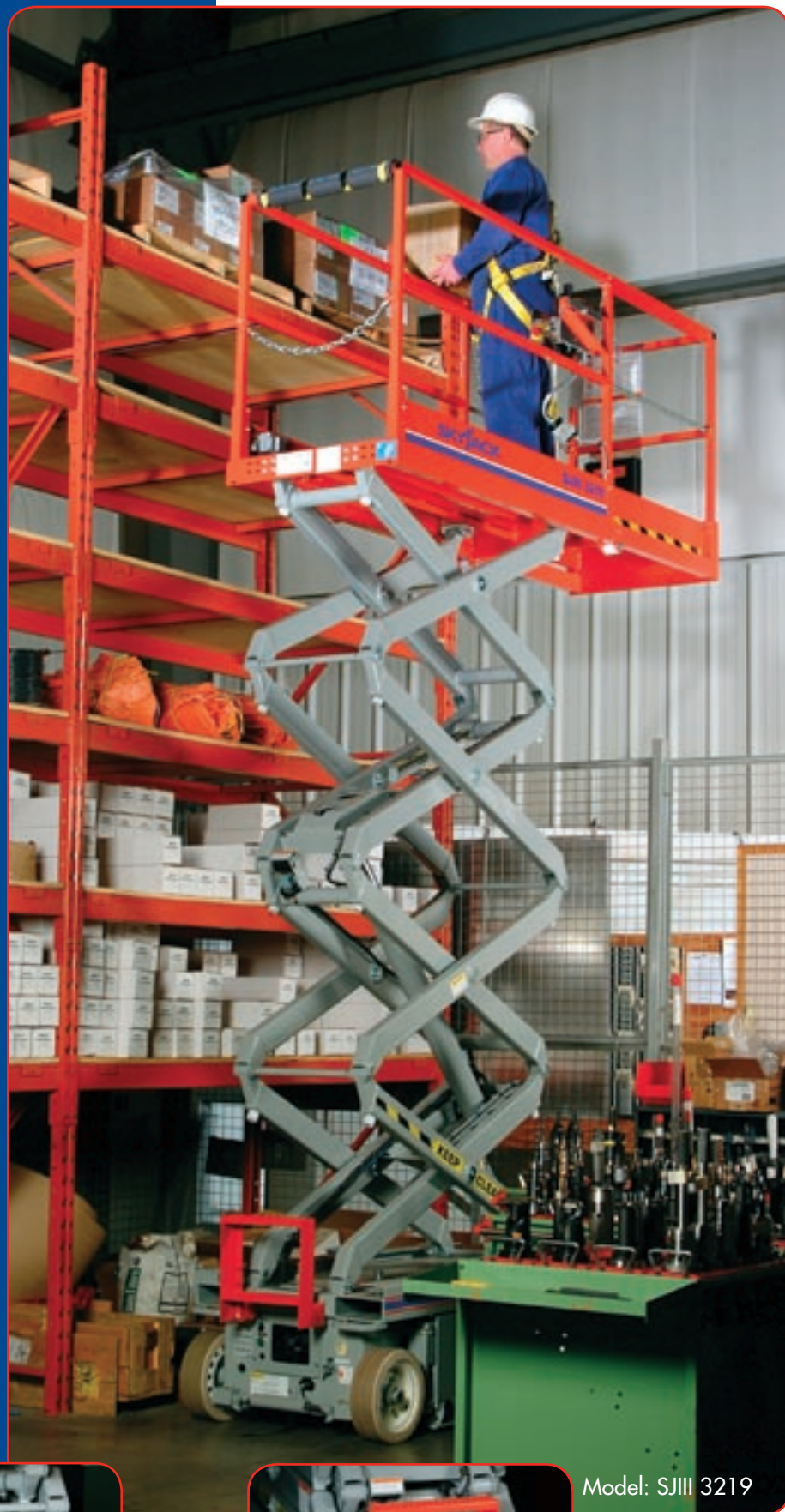
Model: SJIII 3219