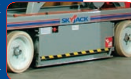
Model: SJIII 4632

Sicherheit ist die primäre Betrachtung bei jeder Arbeit. Die SJIII Schlagloch-Schutzeinrichtung bietet dem Bediener ein Höchstmaß an Sicherheit. (Schlagloch-Schutzeinrichtung nicht verfügbar an 6826/32)