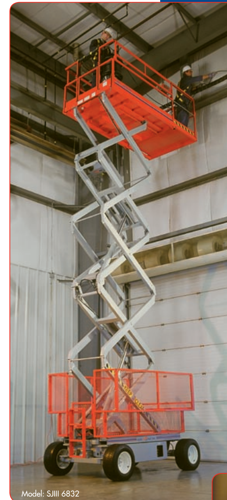
Model: SJIII 6832

SJIII Conventionals haben hydraulischen Hinterradantrieb mit stufenlos regulierbarer Drehzahl